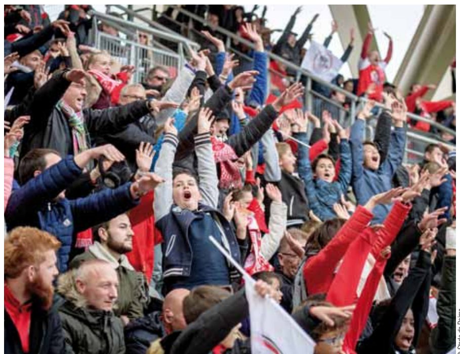
« La ville est fière de pouvoir vibrer pour la réussite de ses clubs »

C'est une responsabilité considérable d'organisation, d'adaptabilité et d'échange journalier avec les associations sportives. Les clubs rémois font la fierté de notre ville et nous tâchons de leur simplifier la tâche administrative et logistique, afin qu'ils puissent se concentrer sur l'aspect sportif de leurs structures. Je crois pouvoir dire que le dialogue est bon et particulièrement efficace avec chacun. L'effervescence sportive de notre ville nous y engage.